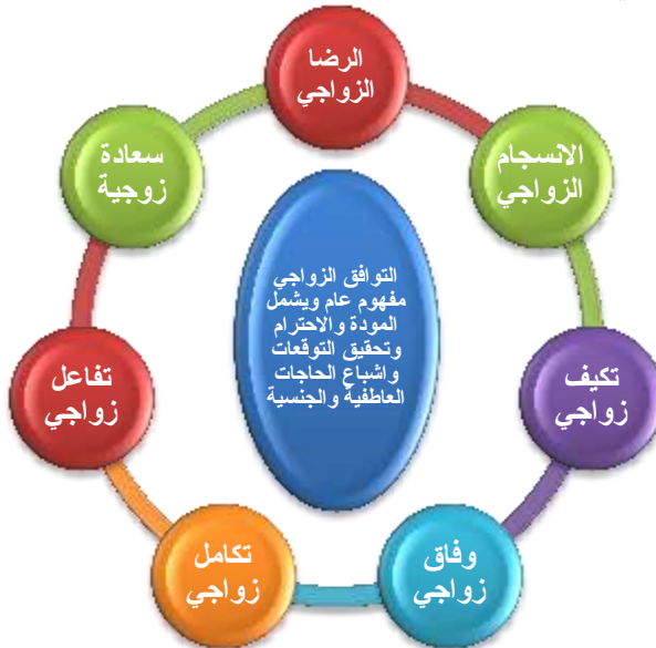
الشكل (١) المفاهيم المرتبطة بالتوافق الزوجي

• التوافق الزوجي وعلاقته ببعض المفاهيم الأخرى: