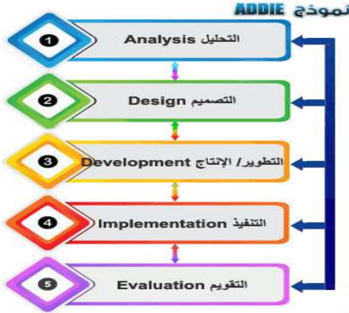
شكل (١) مراحل النموذج العام (ADDIE)