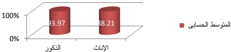
شكل (٢): تمثيل بياني لمتوسطي درجات الذكور والإناث .