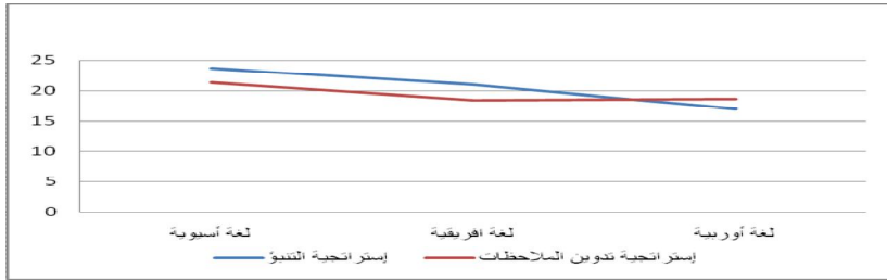
شكل رقم (٢) : رسم بياني يوضح جوانب التفاعل بين متغيري: إستراتيجية التدريس، واللغة الأم في تنمية مهارات الاستماع

وللإجابة عن هذا التساؤل والتحقق من صحة الفرض؛ تم حساب تحليل التباين ثنائي الاتجاه والذي وضحت نتائجه الجدول السابق رقم (٧) ويتضح من هذا الجدول أن قيمة (ف) للفروق في التفاعل بين المجموعات الستة بلغت (10.026)، وهي دالة إحصائيا عند مستوى (٠.٠٥)، وهو ما يعني وجود فروق ترجع لأثر التفاعل بين إستراتيجية التدريس ونوع اللغة الأم. ويتم توضيح التفاعل وجوانبه من خلال الرسم البياني التالي: