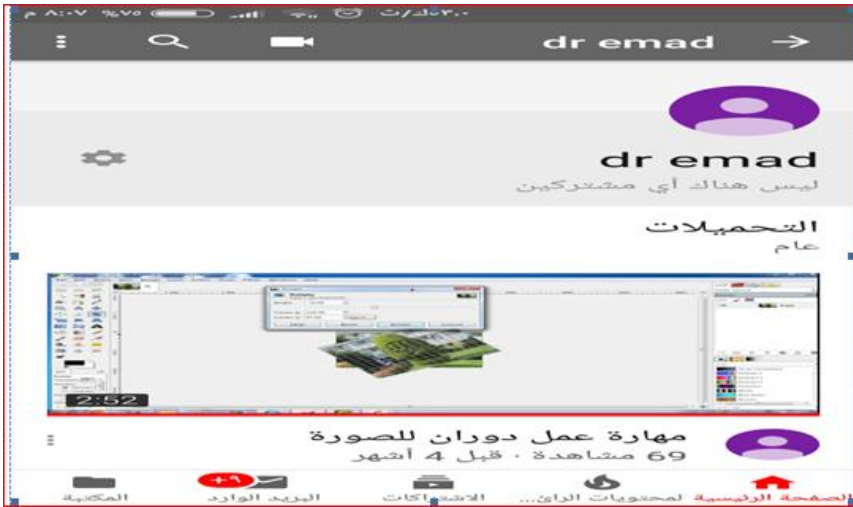
شكل (٢) لقطة من قناة الفيديو الخاصة بالباحث على موقع اليوتيوب.

◀ إنشاء قناة الفيديو التعليمية الخاصة بالباحث على موقع اليوتيوب: تم إنشاء قناة على موقع اليوتيوب بأسم الباحث، من أجل رفع فيديوهات مهارات معالجة الصور الرقمية عليها، وبعد رفع الفيديوهات بالكامل على القناة تم أخذ الرابط الخاص بكل فيديو وتم استخدامه في إنتاج البرنامج. والشكل (٢) يوضح لقطة من قناة الفيديو الخاصة بالباحث على موقع اليوتيوب.