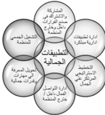
شكل رقم (٧) التطبيقات الجمالية في بيئة العمل

يقوم النهج الجمالي على محورين أساسيين هما المشاعر والخبرات، فالتطبيقات الجمالية تفيد المشاعر السائدة وتنميها، وتدعم الخبرات الإيجابية بالمنظمة وتستفيد حتى من الخبرات السالبة، والقيادة الجمالية تعتمد على المعرفة وتنميتها، حيث تتلاقح الأفكار وتندمج في إطار جمالي، والمنتج الجمالي هنا له بعدين أحدهما فني والآخر أخلاقي، حيث تركز العمليات الإدارية بالمنظمة على الناحية الفنية بحيث يظهر جانب الفن في الإدارة، كما تركز على العمليات الأخلاقية حيث تظهر الأخلاق كتطبيق جمالي للقيادة يمكن تصديره للمنظمات الأخرى فيما يطلق عليه " المنظمة المتعلمة"، حيث تمارس عمليات التعلم التنظيمي داخل وخارج المنظمة (Polat & Öztoprak-Kavak, 2011, 53)، ويمكن توضيح التطبيقات الجمالية كما بالشكل رقم (٧).