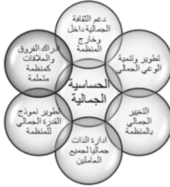
شكل رقم (٨) الحساسية الجمالية في بيئة العمل

حولهم داخل الجامعة، كما يركز أعضاء هيئة التدريس على جمالية ترابط المعرفة بدلا من ترتيبها منطقيا، ويبنى أعضاء هيئة التدريس ثقافة لتفعيل الحس الجمالي ودعم الوعي الجمالي داخل الجامعة، ويفعل أعضاء هيئة التدريس مناخا جماليا داخل الجامعة.