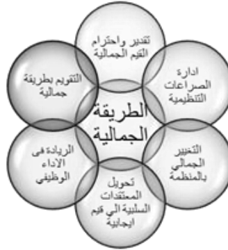
شكل رقم (٥) الطريقة الجمالية في بيئة العمل

ويتضح من الشكل رقم (٥) السابق أنه يمكن تطوير وظائف الجامعة في ضوء الطريقة الجمالية (تحليليا)، وذلك فيما يتعلق بوظيفة التعليم فإنه لتحقيق الطريقة الجمالية يجب أن يحترم أعضاء هيئة التدريس النزعات الجمالية لدي الطلاب، كما يحول أعضاء هيئة التدريس الصراعات بين الطلاب إلى أغراض تنافسية جمالية، ويحرص أعضاء هيئة التدريس على الإبداع الجمالي في تقويم الطلاب، ويعبر أعضاء هيئة التدريس عن مشاعرهم أمام الطلاب بطريقة جمالية، ويغير أعضاء هيئة التدريس المعتقدات السلبية عن الجمالية إلى معتقدات إيجابية لدي الطلاب، كما أن عضو هيئة التدريس رائد في التدريس بطريقة جمالية للطلاب.