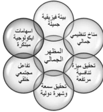
شكل (١٠) المظهر الجمالي في بيئة العمل

ويتضح من الشكل (١٠) السابق أنه يمكن تطوير وظائف الجامعة في ضوء المظهر الجمالي (تحليلياً)، وذلك فيما يتعلق بوظيفة التعليم فإنه لتحقيق المظهر الجمالي يجب أن يثير أعضاء هيئة التدريس إعجاب الطلاب لهم بحسن أدبهم ومظهرهم، كما يتسم الأداء الوظيفي لأعضاء هيئة التدريس بالجمال، ويتعامل أعضاء هيئة التدريس مع بعضهم البعض ومع رؤسائهم بطريقة رائعة، ويثير التصميم الداخلي للجامعة الإحساس بالروعة والجمال.