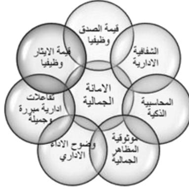
شكل رقم (٩) الأمانة الجمالية في بيئة العمل

ويتضح من الشكل رقم (٩) أنه يمكن تطوير وظائف الجامعة في ضوء الأمانة الجمالية (تحليليا)، وذلك فيما يتعلق بوظيفة التعليم فإنه لتحقيق الأمانة الجمالية يجب أن يكون عضو هيئة التدريس متواضع وصادق في نقده للطلاب، وتكون أفكار أعضاء هيئة التدريس في الجمالية متوافقة مع الممارسة، ويدعم أعضاء هيئة التدريس الحرية الأكاديمية للطلاب بما يحقق الأداء الجميل لهم ولطلابهم.