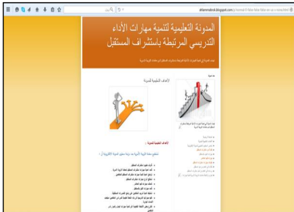
شكل رقم (٢): واجهة الأهداف التعليمية للمدونة الالكترونية المقترحة