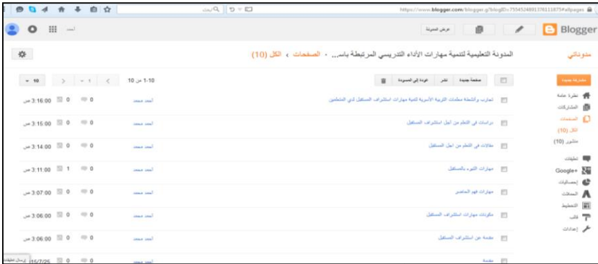
شكل رقم (٤): الواجهة الداخلية للتحكم في المدونة التعليمية